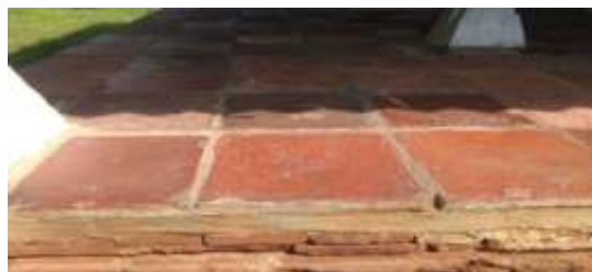
Gambar11. Bentuk keramik

Pada zaman dahulu, Sunan Gunung Jati sangat terbuka terhadap berbagai budaya agar agama Islam mudah diterima oleh masyarakat tanpa mengancam tradisi dan budaya yang lebih dahulu masuk. Sikap terbuka inilah yang pada akhirnya membuat Keraton