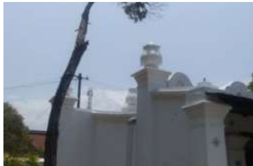
Gambar10 . Bentuk teratai pada bangsal utama Keraton Kasepuhan

lain juga terlihat pada gapura Siti Inggil yang bercorak budaya Hidhu lalu dipadukan dengan tempelan ragam hias keramik dari Cina. Perpaduan ini membuat gapura pada Keraton Kasepuhan terlihat lebih menarik. Akulturasi dengan budaya Cina yang kedua terlihat dari perpaduan warna di Keraton Kasepuhan yaitu warna Merah. Warna merah diambil dari budaya Cina karena melambangkan sebuah sifat Keberanian. Warna merah yang hadir diantara dominan warna hijau dan Kuning ini membuat bangunan di Keraton Kasepuhan terlihat lebih hidup dan menarik perhatian. Akulturasi yang ketiga terlihat Akulturasi pada Keraton Kasepuhan terlihat dari atap gapura pada bangsal utama Keraton Kasepuhan yang menyerupai bentuk teratai. Dalam filosofi Cina, teratai melambangkan kesucian dan kemurnian. Kemudian Akulturasi yang keempat terlihat dari motif keramik yang digunakan pada lantai bangunan pada Siti Inggil. Terdapat keramik tanah liat berwarna merah yang memiliki tebal sekitar tujuh centimeter yang biasanya digunakan pada lantai rumah Cina benteng Tangerang.