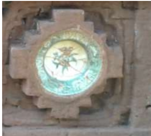
Gambar 9. Motif ikan pada keramik di dinding gapura Siti Inggil

Motif keramik ikan, Eberhard (2006 : 124) menjelaskan bahwa kata untuk ikan (鱼- Yú) secara fonetis identik dengan kata yang berarti kelimpahan, kemakmuran sehingga ikan melambangkan kekayaan. Untuk gambar sepasang ikan melambangkan harmoni, senang berhubungan bersama dan pengembangan kepribadian yang biasanya diberikan untuk hadiah pernikahan