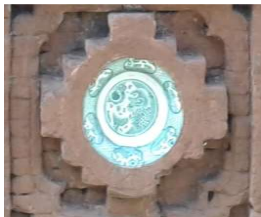
Gambar 8. Motif singa dengan bola pada keramik di dinding gapura Siti Inggil

Pada Siti Inggil terdapat motif keramik hewan seperti singa dan ikan. Untuk Singa dengan bola. Eberhard (2006 : 197) menjelaskan bahwa Menurut satu tradisi, singa yang berada dalam bola sulam, diibaratkan seperti dalam telur di dalam cangkang, tetapi yang lain mengatakan bahwa ini bukan benar-benar bola melainkan mutiara besar yang dimainkan singa untuk menenangkan kegelisahannya. Gambaran singa melempar bola sulam adalah metafora untuk hubungan seksual.