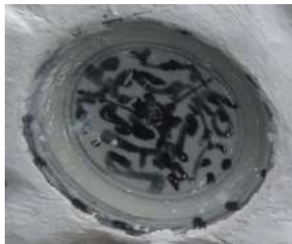
Gambar 6. Motif Naga dengan sembilan putra di dinding gapura Pintu Buk Bacem

Motif naga yang lain pada dinding gapura pintu buk bacem bergambar naga dengan sembilan putra yang memiliki sifat berbeda-beda. Eberhard (2006 : 100) menjelaskan Yang pertama dapat membawa benda-benda berat, yang kedua dapat memadamkan api, yang ketiga dapat membuat suara seperti bel, yang keempat mempunyai kekuatan seperti harimau, yang kelima menyukai makanan, yang keenam menyukai air, yang ketujuh adalah pejuang yang berani, yang kedelapan kuat seperti singa, yang kesembilan adalah pengamat yang tajam