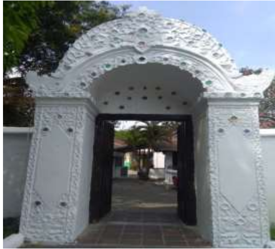
Gambar4 . Gapura pintu Buk Bacem

Keramik-keramik ini memiliki motif lukisan yang berbeda-beda. Ada yang bermotif pemandangan, beragam motif bunga dan binatang. Lukisan dapat menjadi alat untuk mendapatkan keseimbangan fengshui 風水 seperti yang sudah disampaikan pada bab sebelumnya. Fungsi lain dari keramik-keramik yang sengaja ditempel di dinding gapura dan pada bangsal utama agar tidak hilang dan rusak serta agar gapura terlihat lebih indah. Keindahan dapat mengubah suasana hati menjadi positif dan mengusir energi negatif yang dibawa oleh tubuh.