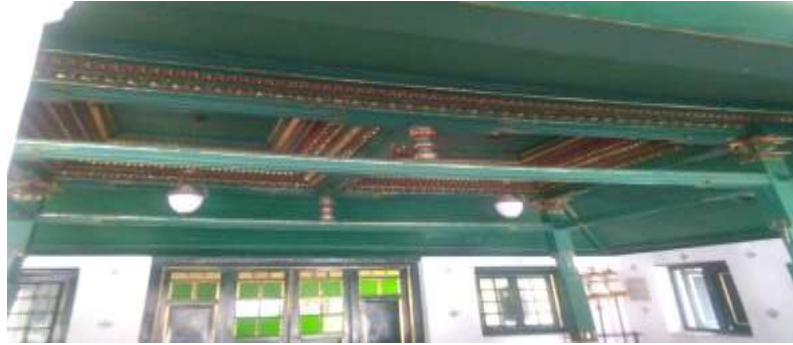
Gambar 1. Lampu gantung di Jinem Pangrawit Keraton Kasepuhan

fengshui 風水 juga dapat memberikan kesan mewah dan klasik pada ruangan sehingga menimbulkan seseorang tertarik datang untuk berkunjung.