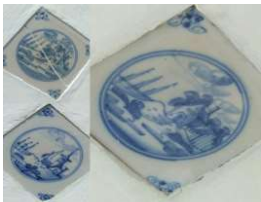
Gambar 10. Motif pemandangan pada keramik di dinding Jinem Pangrawit