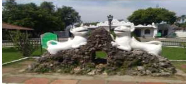
Gambar 3 . Sepasang patung macan

Di sebelah kanan dan kiri sepasang patung macan terdapat sepasang meriam yang bernama Ki Santoma dan Nyi Santomi peninggalan Prabu Kabunangka Pakuwan kerabat dari pangeran Cakrabuana. Meriam Ki Santoma terletak di sebelah kanan dari arah pintu masuk Regol Gledengan dan Meriam Nyi Santomi terletak di sebelah kiri dari arah pintu masuk Regol Gledeng. Meriam ini diarahkan langsung ke arah pintu masuk yang digunakan sebagai pertahanan. Meskipun baik digunakan dalam perlindungan dan pertahanan, Akan tetapi dalam teori fengshui 風水 benda tajam dapat melukai orang haruslah dihindari karena dapat menimbulkan pembalasan dan energi qi 氣 negatif yang dihasilkan dapat berbalik memukul kembali. Pada zaman dahulu, Meriam di Keraton Kasepuhan yang di letakkan menghadap arah pintu masuk digunakan untuk melindungi Keraton Kasepuhan dari serangan musuh.